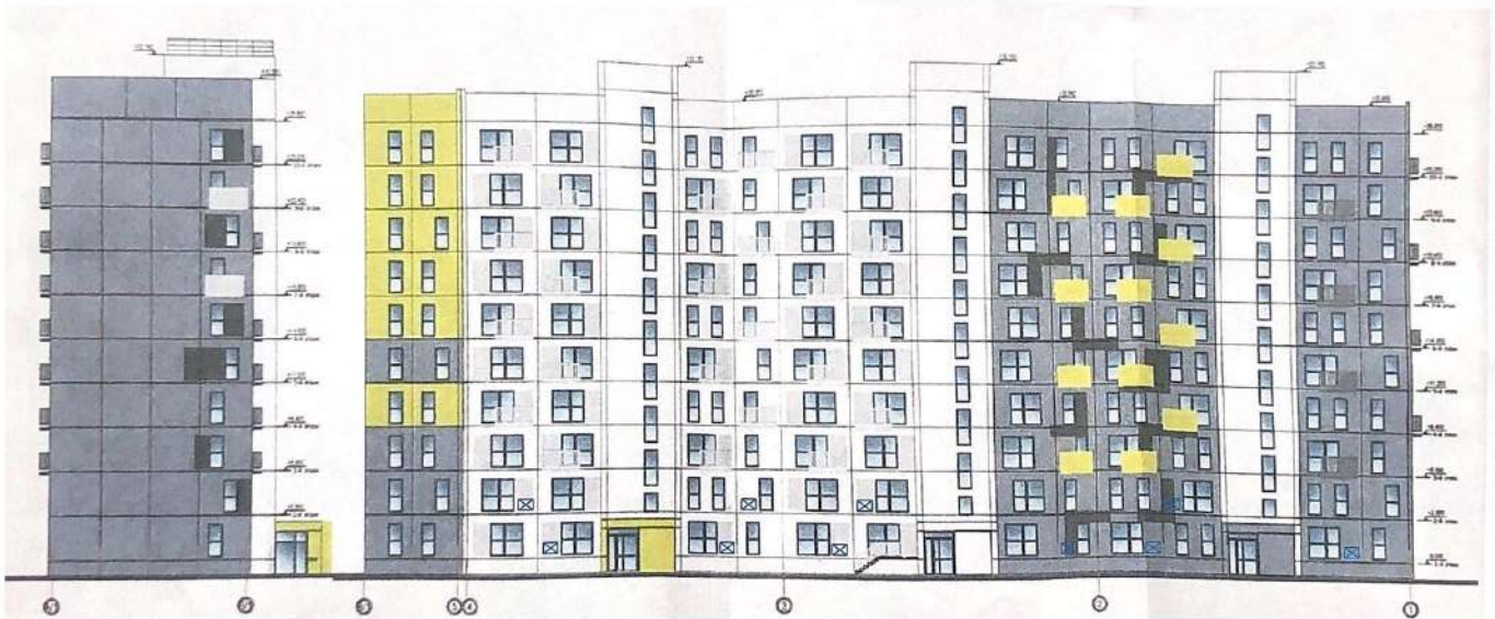
Схема размещения наружных блоков сплит-систем квартир 1-го, 2-го этажа многоквартирного жилого дома, расположенного по адресу: г. Челябинск, ул. Блюхера, д. 123Д